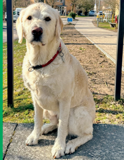
EINER VON UNS