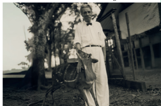
„Antelöpel“ – laut Schweitzer „ein perfekter Egoist“, ein Charakterzug, den er nur Tieren durchgehen ließ.